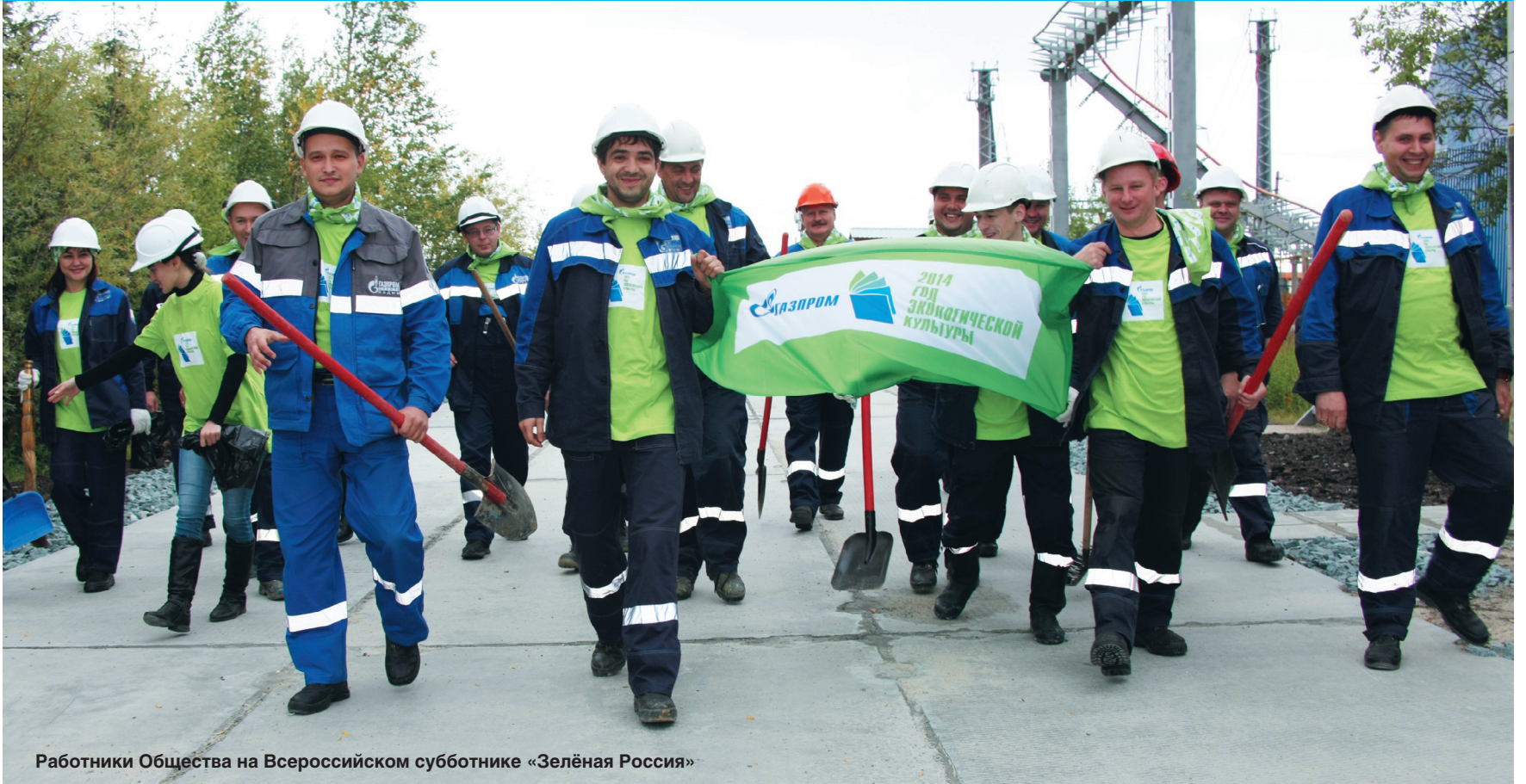
Работники Общества на Всероссийском субботнике «Зелёная Россия»