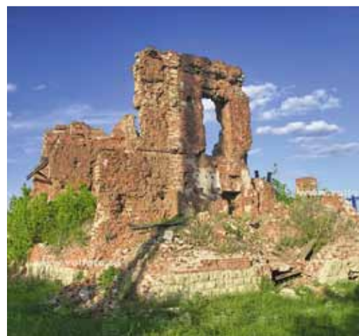
Руины командного пункта 138-й стрелковой дивизии