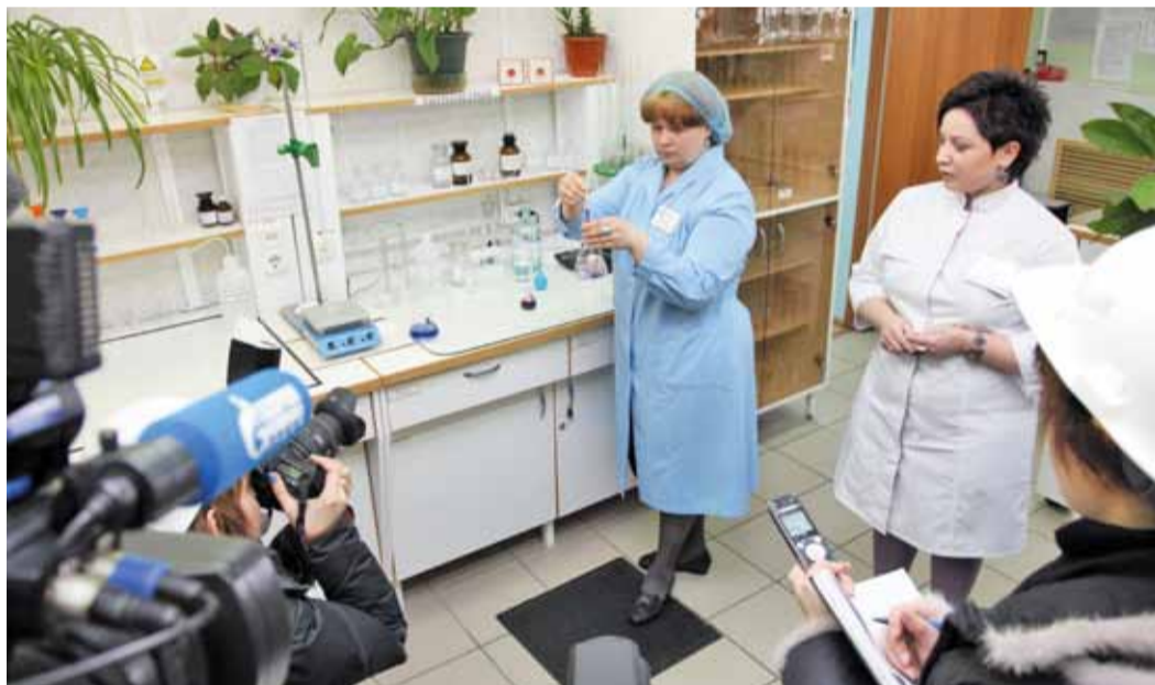
В химической лаборатории станции водоочистки воду проверяют каждый день по 27 критериям