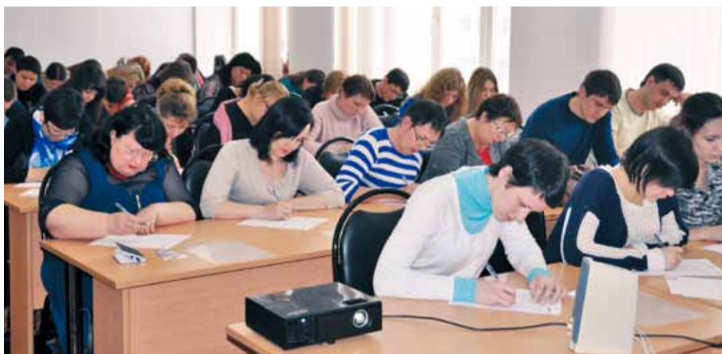
На первый в Надyme Тотальный диктант пришло 53 человека