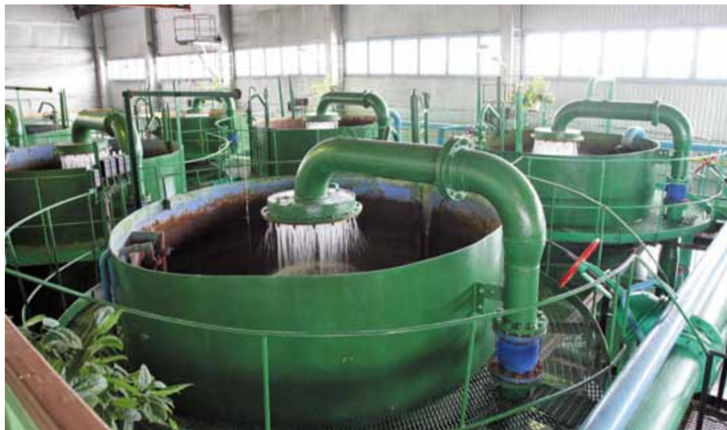
Новые фильтры на станции пангодинского водозабора работают медленнее, но более качественно.