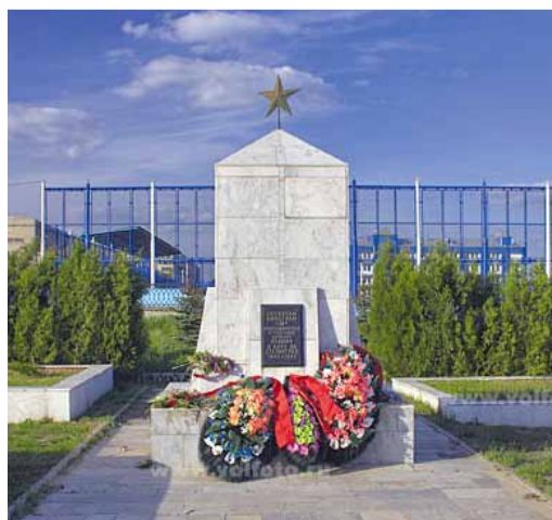
Братская могила в мемориале «Остров Людникава»