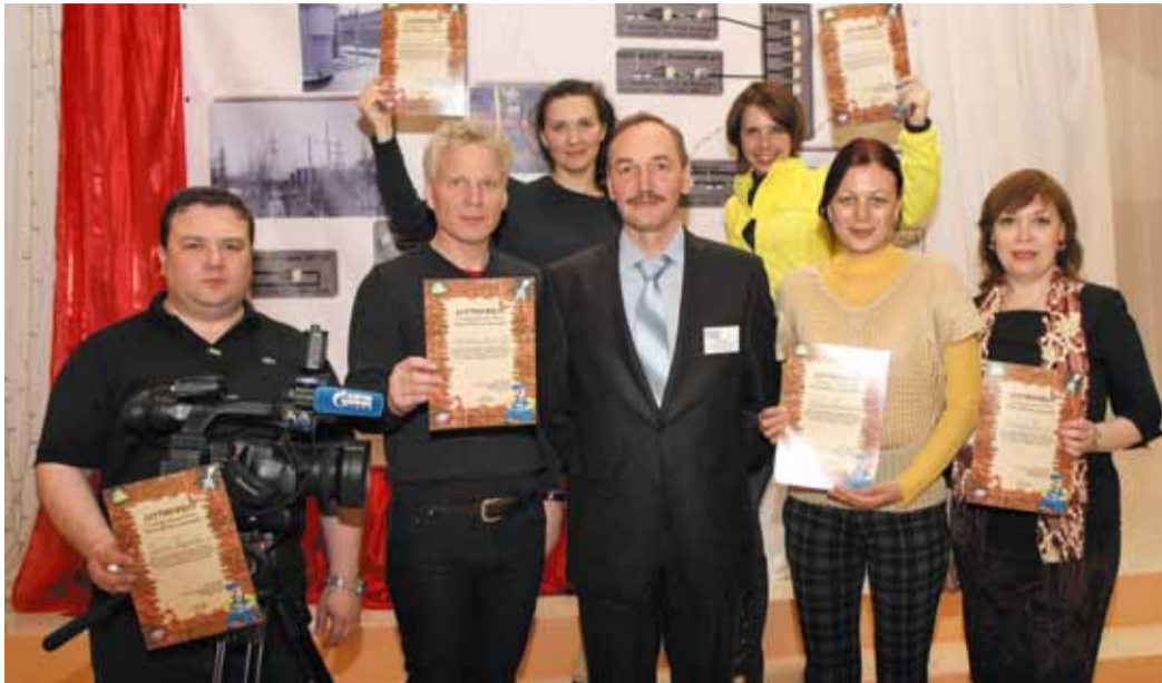
Команда-победитель квеста «Почём ЖКХ для ямальцев?» от «Газпром энерго»

Ещё пара технологий по сбережению энергоресурсов вот-вот обретёт силу на месторождении Медвежье. Это – снижение утечки воды и уменьшение затрат на её подогрев с помощью новой водонасосной на ГП-7, а также ввод «свежих» водоочистной станции и котельной, которая будет экономить тридцать процентов газа, идущего на отопление Ныдинского водозабора. Эти объекты уже сейчас готовятся принимать на поруки надымский филиал общества «Газпром энерго», который заботится об энергоресурсах в посёлке Пангоды.