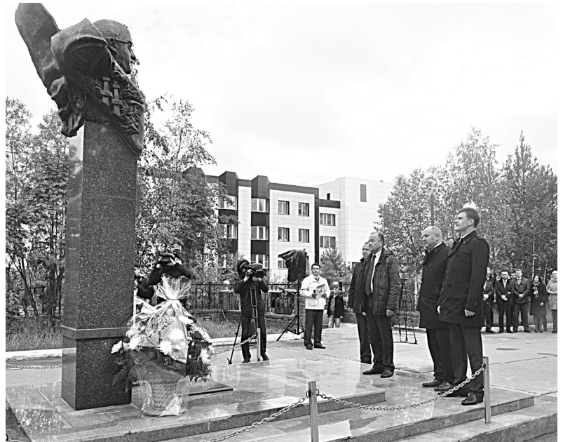
■ И в мраморе, и в памяти.

Всё, что приходилось делать в то время, можно начинать с наречия «впервые», ведь в условиях мерзлоты подобное не производилось ранее не только в СССР, но и в мире. Не было серьёзной теоретической опоры, газовики получали рекомендации, основанные на опыте разработки кубанских месторождений. Где