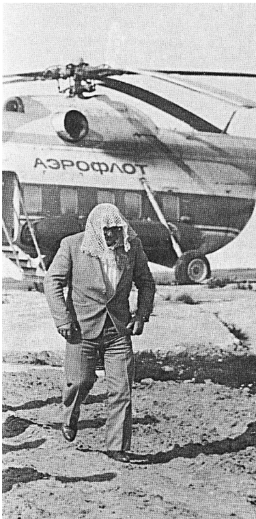
■ Посадка в тундре: мошка званий не различает