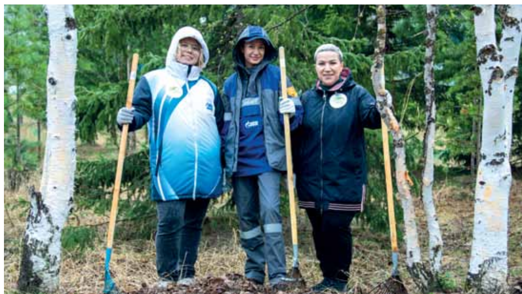
Традиция наводить чистоту после таяния снега поддерживается в «Газпром добыча Надым» уже много лет