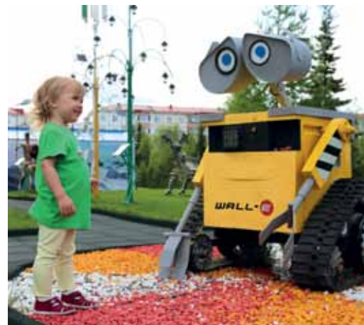
Приятно поговорить с умным роботом WALL-E