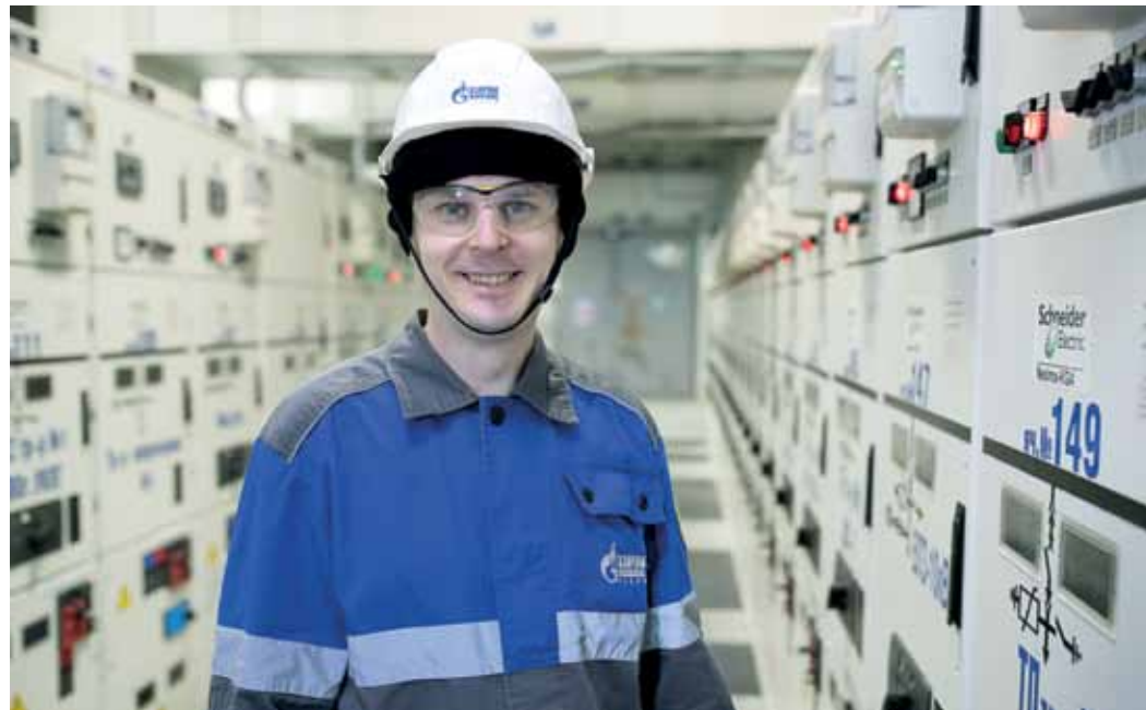
Хотел на Бованенково – попал на Бованенково

Всё, что касается энергии и электрооборудования на ГП, – это к Валерию. От огромных газоперекачивающих агрегатов до освещения – он и его коллеги-энергетики отвечают