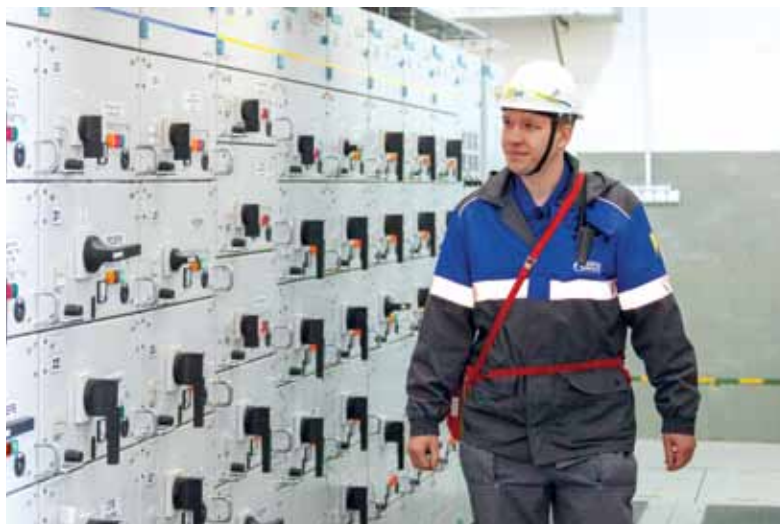
Контроль электроснабжения потребителей промысла на ДКС