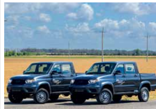
«Патриоты» для настоящих патриотов

Приобрести востребованную технику и предметы удалось на средства благотворительного проекта «От чистого сердца из Арктики». Напомним, он проходил в апреле этого года. Для поддержки защитников Отечества коллектив «Газпром добыча Надым» пожертвовал 4,3 млн рублей.