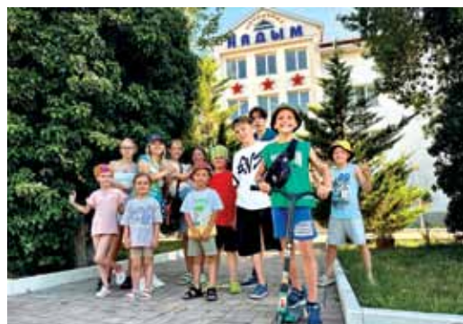
«Надым» – там, где новые друзья