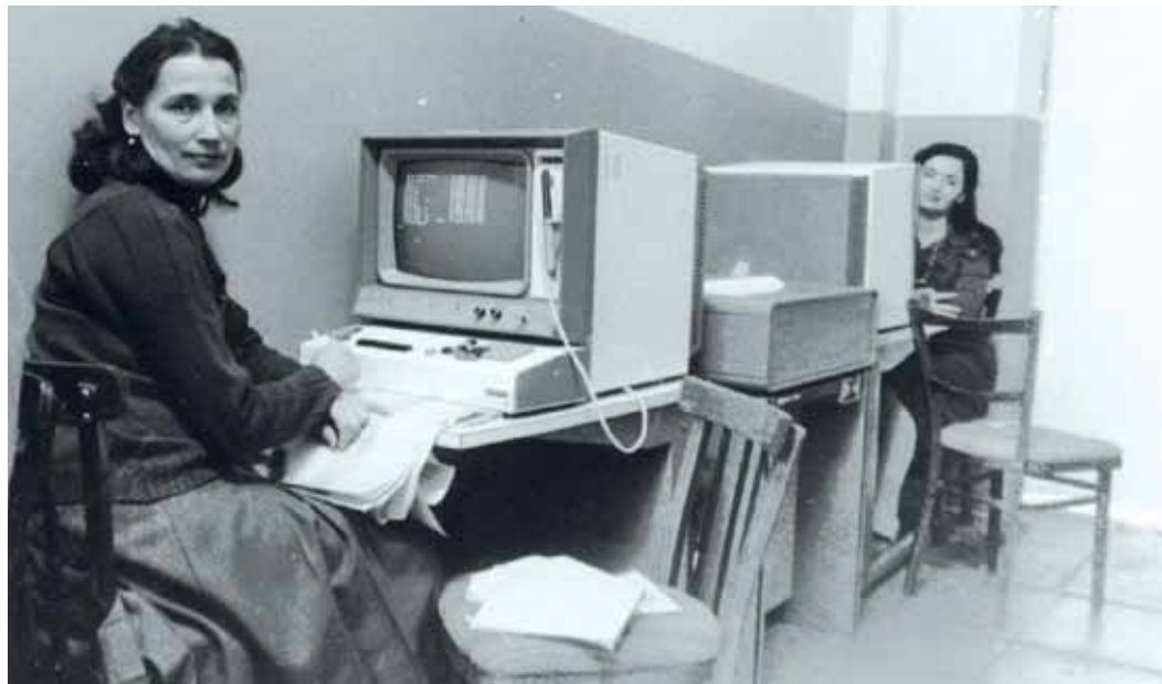
Специалисты АСУ в машинном зале за удалённым устройством управления.

В их руках – все локальные информационные системы, которые растут и развиваются внутри компании. Каждый день по написанным ими маршрутам циркулируют тысячи писем, заключаются контракты, выдаются поручения, начисляется зарплата. Они – «модераторы» нашей офисной жизни, без которых уже сложно представить любой рутинный процесс. Хотя, пожалуй, и это описание кажется слишком поверхностным, учитывая весь массив задач IT-подразделения. Полвека назад в Производственном объединении «Надымгазпром» был организован отдел автоматизированных систем управления (АСУ), который сегодня мы знаем под именем СИУС – служба информационно-управляющих систем.