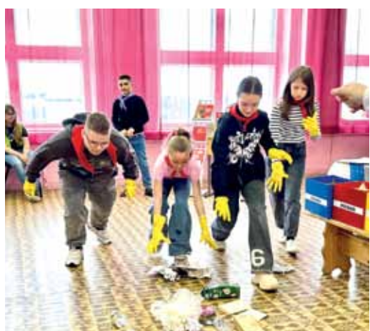
Участники практикума на скорость собирали мусор

Оксана ЗАХАРОВА