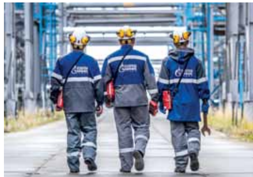
Рациональные мысли на максимум

Интеграция в рационализацию. Маршрут построен. От небольшой модернизации технологического оборудования до глобального изменения конструкций узлов, от экономии топливно-энергетических ресурсов до минимизации трудозатрат, от повышения экологической и промышленной безопасности