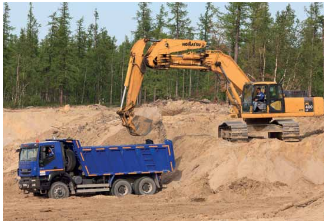
Соблюдение ключевых правил безопасности – единое требование для работников компании и подрядчиков

В «Газпром добыча Надым» продолжается выполнение Плана по совершенствованию культуры производственной безопасности. Первый месяц лета посвящён одному из 12 ключевых правил безопасности ПАО «Газпром» – «Проводите земляные работы по действующему наряду-допуску».