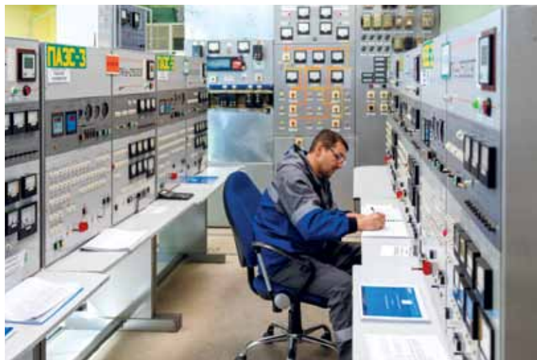
Испытание под максимальной нагрузкой цепей автоматического пуска ПАЭС