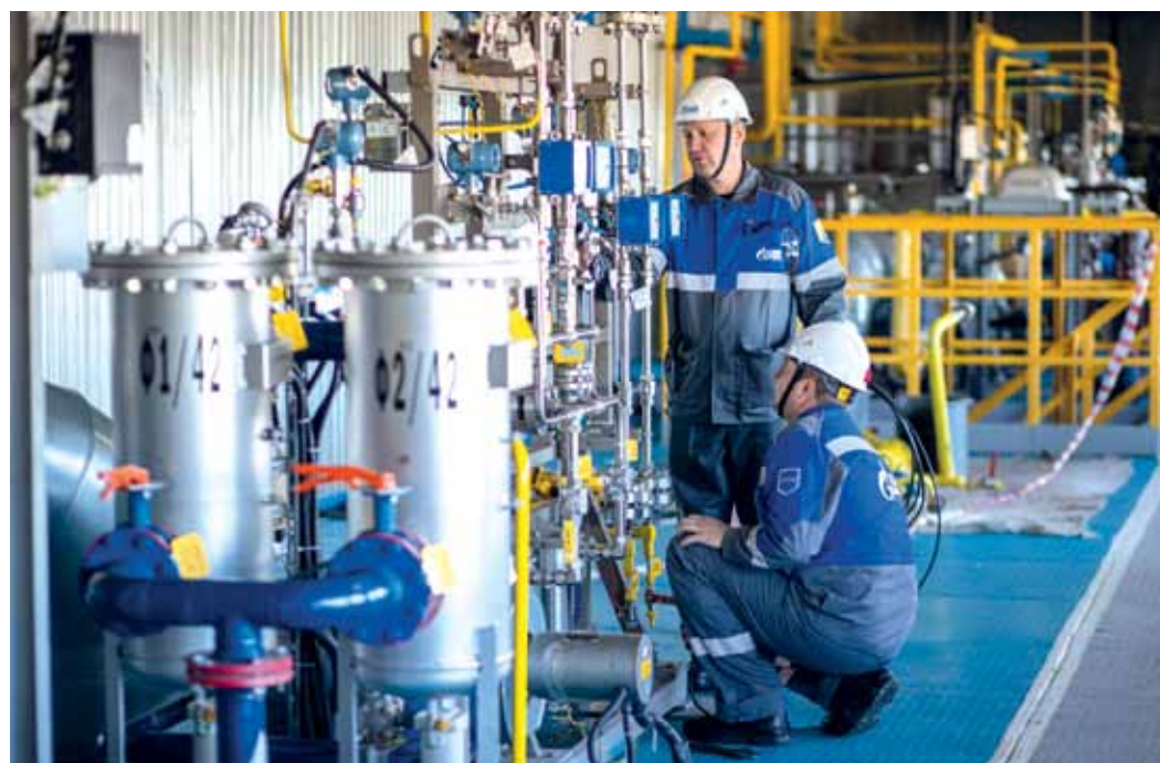
Инженерные изыскания работников «Газпром добыча Надым» выливаются для компании в экономию больших денег