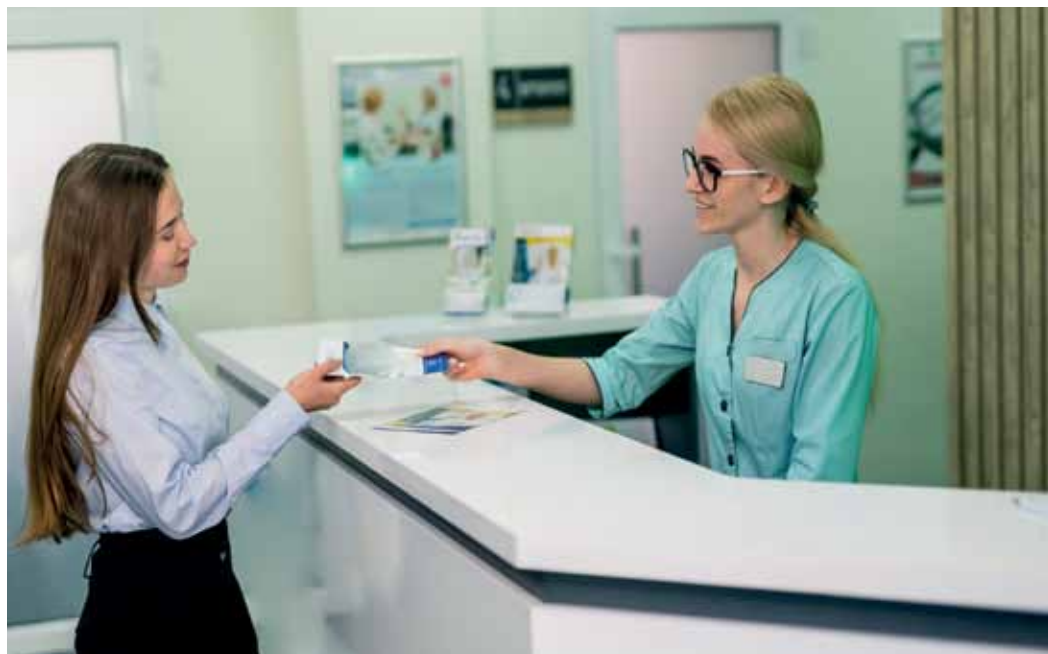
Оформить социальный налоговый вычет можно в любое время года

Разберём алгоритм действий для получения компенсации за лечение (платные услуги по сдаче анализов, КТ, МРТ) и покупку медикаментов.