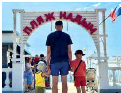
До свидания, шумный город

В южном филиале компании – пансионате «Надым» в селе Кабардинке Краснодарского края – оздоровительный сезон в самом разгаре. Чёрное море уже прогрелось до +23 °С, а наши коллеги работают на все сто процентов, чтобы северяне наслаждались отдыхом, набирались сил и здоровья под тёплым солнцем. За два месяца в здравнице уже побывали 658 человек – работники «Газпром добыча Надым» с семьями. Каждый год пансионат радует отпускников своим преображением – гостиничные номера и территория становятся уютнее. В столовой для курортников разработано меню на любой вкус, обогащённое сезонными овощами и фруктами. А на открытом воздухе аниматоры проводят насыщенные спортивные и развлекательные программы как для детей, так и для взрослых. Самые лучшие отзывы – это счастливые лица отдыхающих!