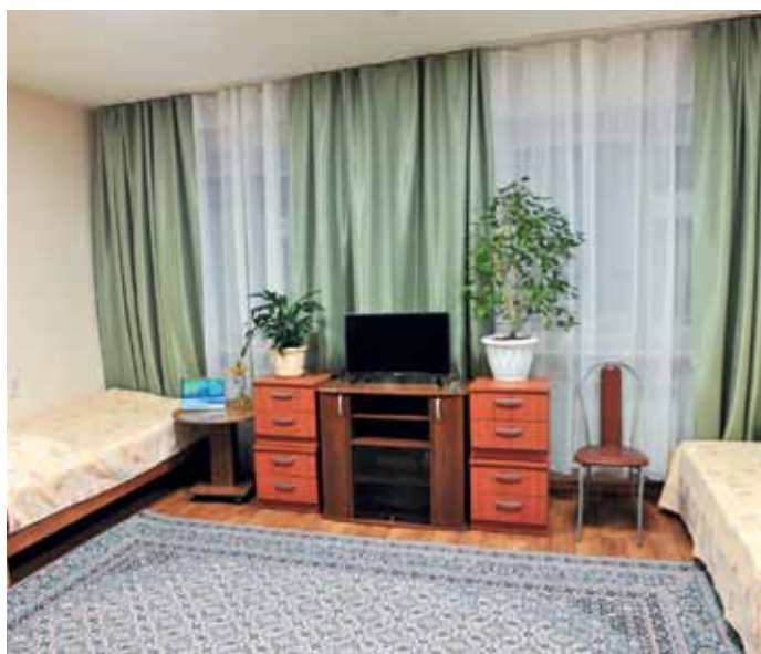
Жилые комнаты Юбилейного и Ямсовейского месторождений