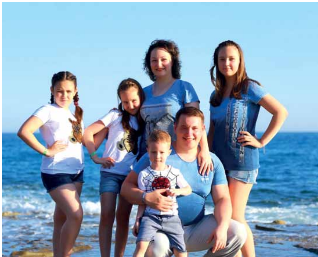
Если ехать отдыхать на море, то только всем вместе