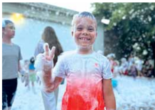
Пенное шоу – это невероятно весело!