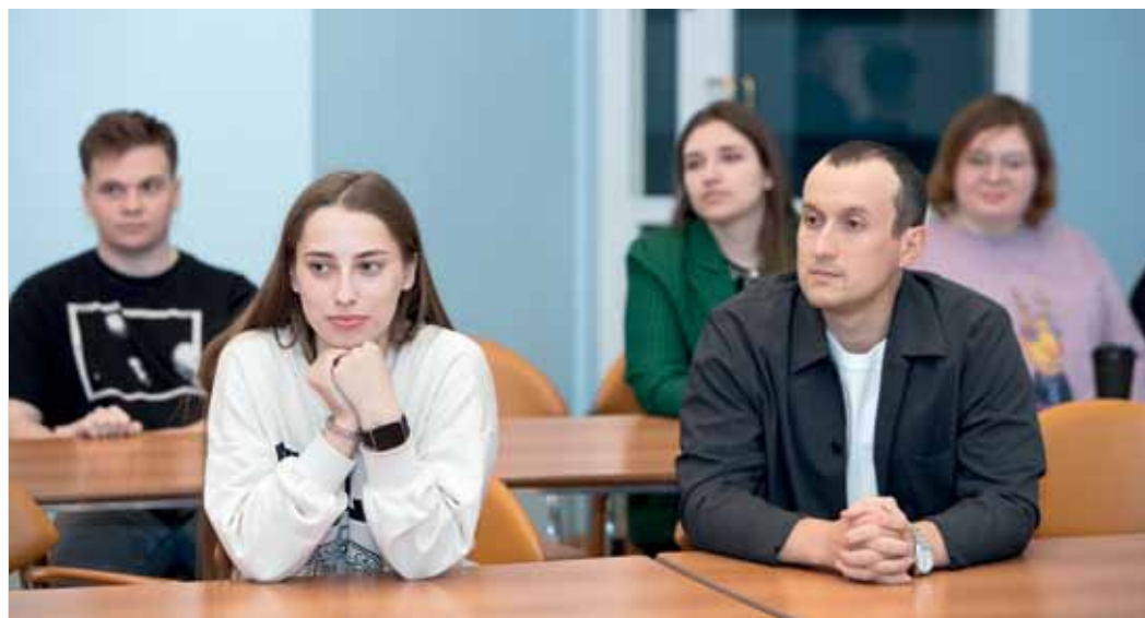
В диалоге с руководителем принял участие актив Совета молодых учёных и специалистов компании