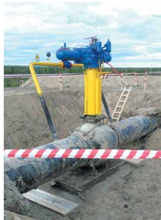
Проведение земляных работ Медвежинским ГППУ