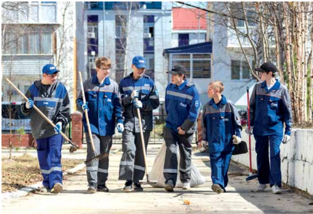
В первый месяц лета в компании трудились 96 подростков