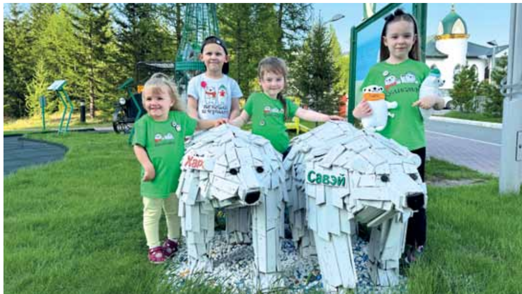
Экокультурные дети оккупировали косопалых сотрудников зелёного музея. «Топим» за природосбережение