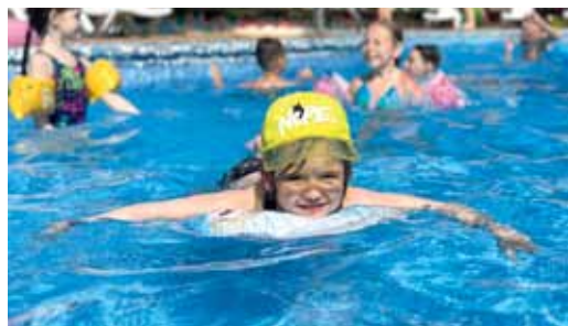
От водных развлечений – много впечатлений!