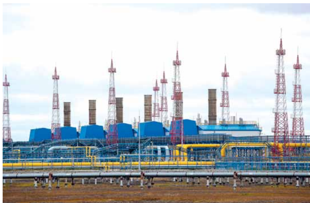
Обращаем вызовы времени в собственный рост. В объективе – Бованенково