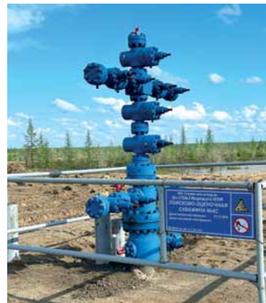
Первооткрывательница сложного газа Медвежьего

– Впереди планируется ввод 4С в опытно-промышленную эксплуатацию. Это намечено