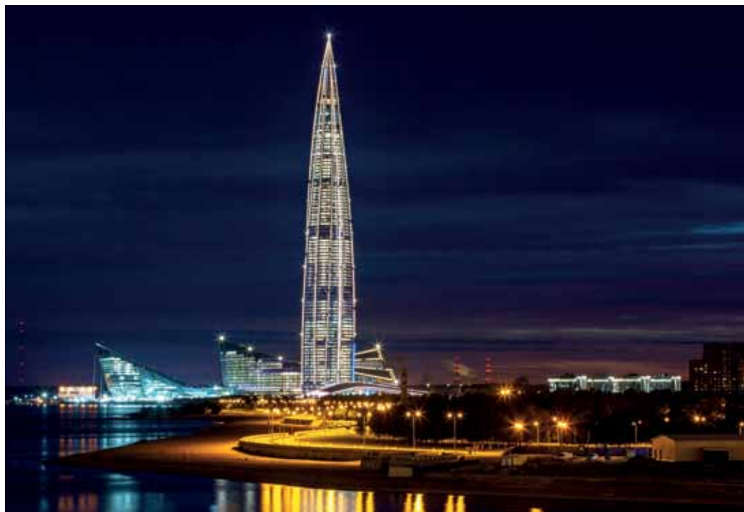
ПАО «Газпром» представил отчёт о социальной деятельности компании за 2023 год

Огромный коллектив Газпрома – почти полмиллиона человек – работает по всей России, от Калининграда до Камчатки, и за рубежом. Для каждого сотрудника обеспечиваются безопасные условия труда, высокий уровень социальной защищённости и широкие возможности для обучения и развития компетенций. Регулярно проводятся конкурсы