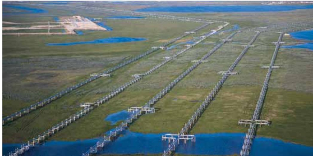
Бованенковское месторождение – флагман Ямальского центра газодобычи