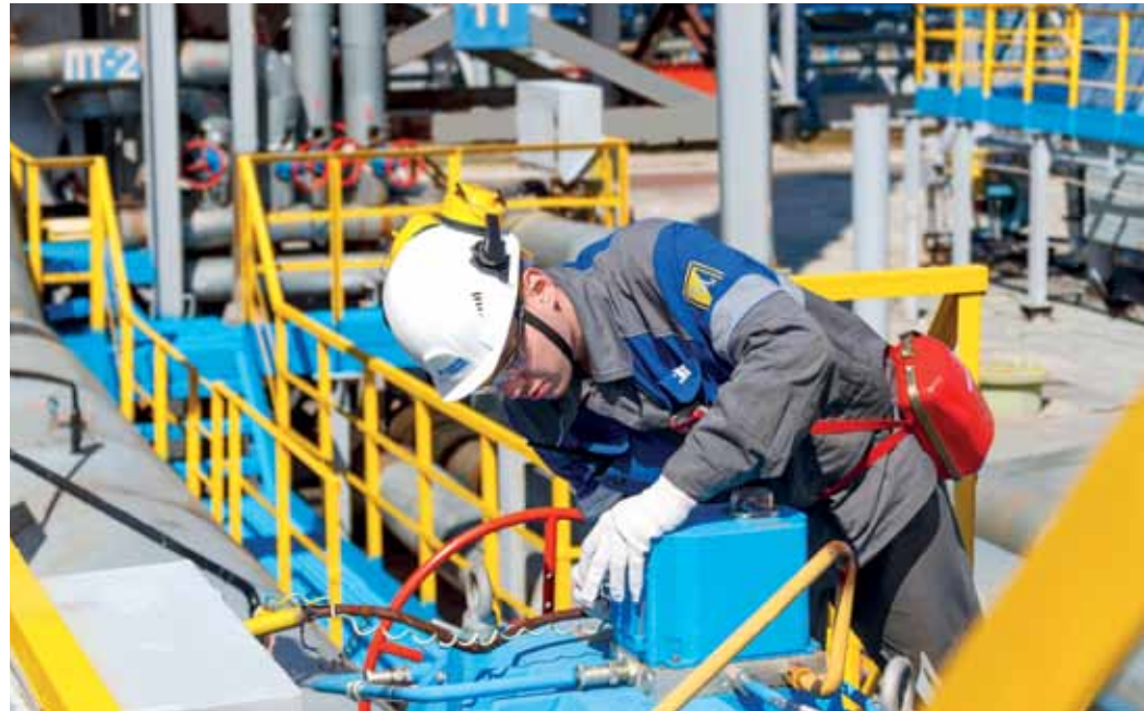
Наращивая свою газоперекачивающую мощность, предприятие даёт развитие энергомашиностроению России

На протяжении всего срока службы ГПА происходит их совершенствование. Производственники вносят изменения в работу узлов, которые упрощают их эксплуатацию, а порой устраняют, нивелируют конструктивные упущения. Каждый агрегат индивидуален, говорят они, у каждого, несмотря на унификацию и однотипность, – свои характер и манера поведения. Сложности могут быть вызваны цепочкой предшествующих