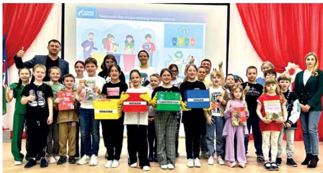
В Медвежинском ГПУ считают, что пробуждать интерес к охране окружающей среды необходимо с детства

– Очень приятно, что к мероприятию присоединились наши друзья из поселковой библиотеки,