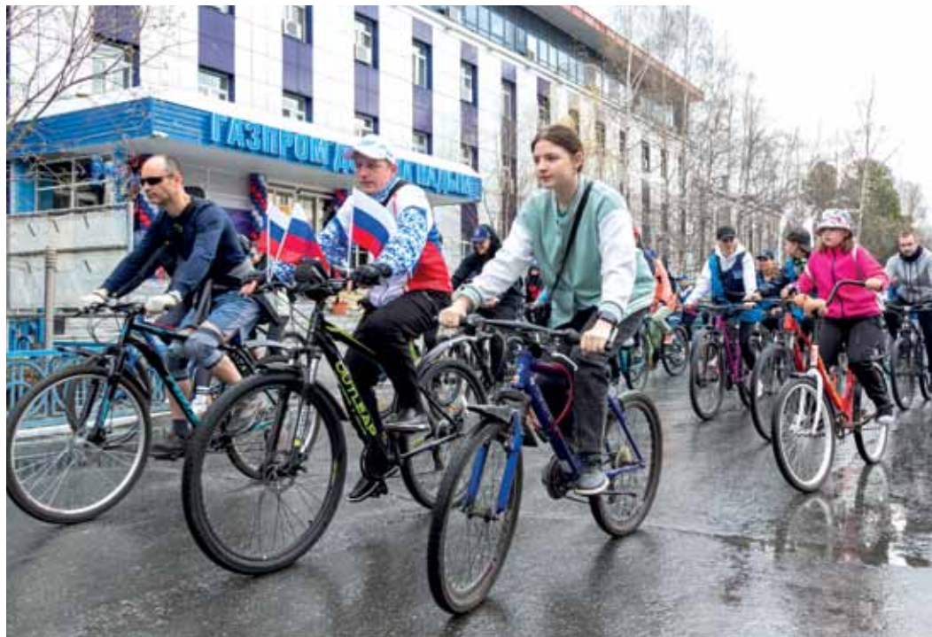
Поехали! В велопробеге, посвящённом Дню России, одновременно стартовали более 165 участников