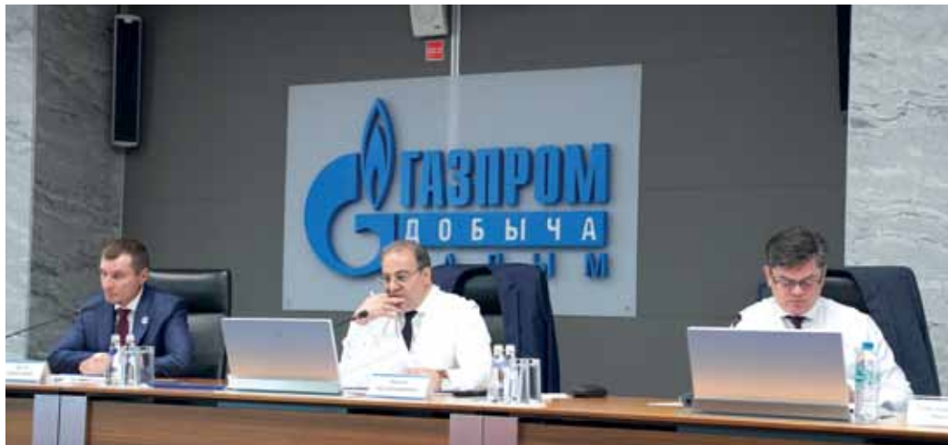
Во внимании отраслевиков – богатства надсеноманских отложений

Сеноман не бесконечен. Во внимании отрасли – освоение надсеноманских отложений. Опыт их изучения и проектные решения в июне обсуждали на базе «Газпром добыча Надым». Компания стала площадкой для выездного заседания Комиссии газовой промышленности по разработке и исследованию недр ПАО «Газпром» и рассмотрению итогов выполнения Программы освоения трудноизвлекаемых и нетрадиционных ресурсов газа.