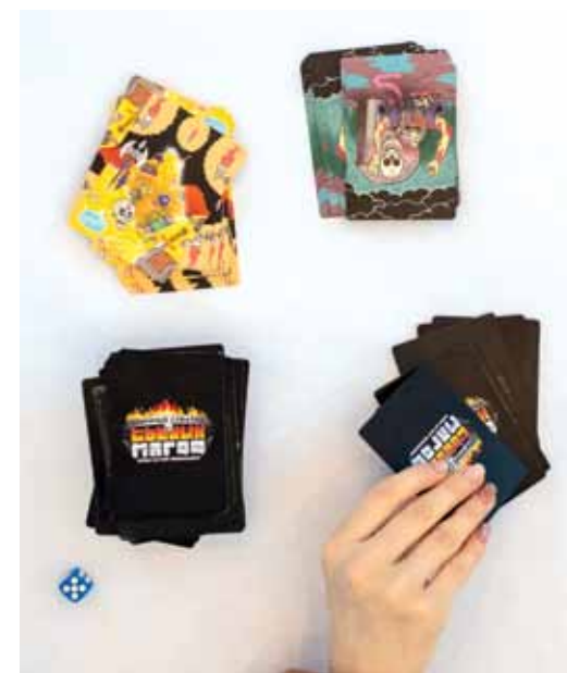
Карты – самый распространённый атрибут игры

В июне прошли две встречи за игровым столом. В планах Совета молодых учёных и специалистов «Газпром добыча Надым» создать игровую лигу, где можно будет бороться за кубок.