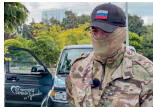
Защитники Отечества бесконечно признательны

В дар бойцам передали двух серьёзных помощников — новые автомобили УАЗ «Патриот». Кроме этого, им доставили необходимое оборудование и комплекты тактического защитного снаряжения. Перечень материальных ценностей был сформирован по запросу адресатов.