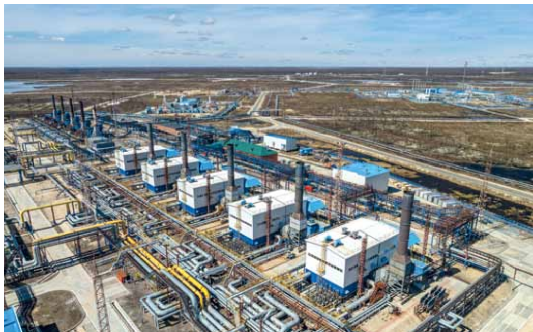
Юбилейное нефтегазоконденсатное месторождение – вторая газовая кладовая в копилке «Газпром добыча Надым»