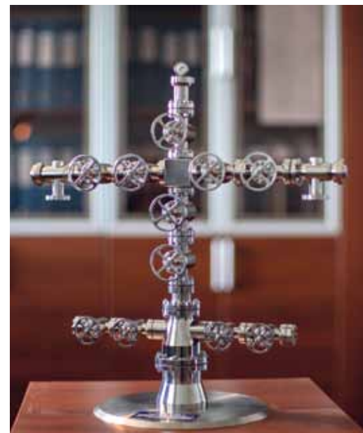
Макет юбилейки изготовили ремонтники компании

По материалам геологического отдела, газеты «Тюменская правда»