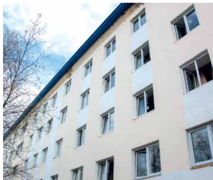
Общежитие № 1 на Полярной, 3 в городе Надыме