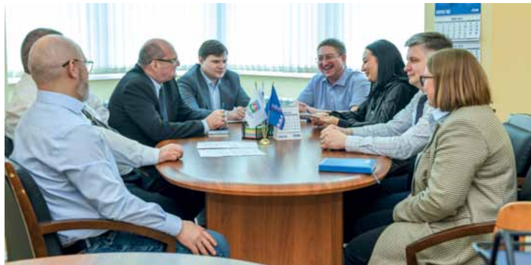
Предпраздничное рабочее совещание проходит в приподнятом настроении

Анна ПИРОГОВА