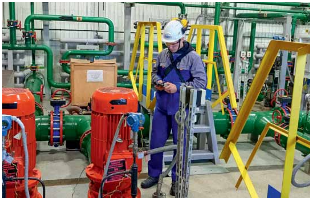
Инструментальные измерения в одном из производственных цехов Бованенковского месторождения