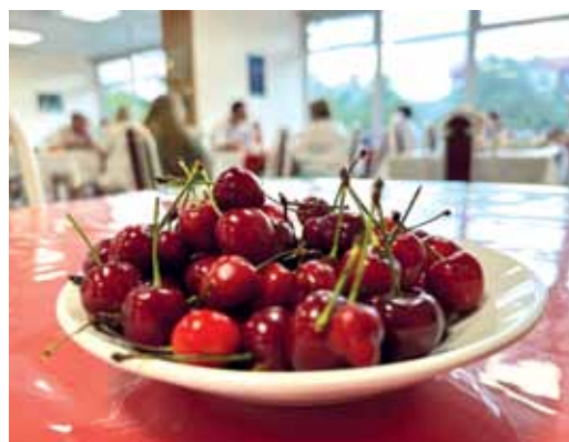
Лето в тарелке