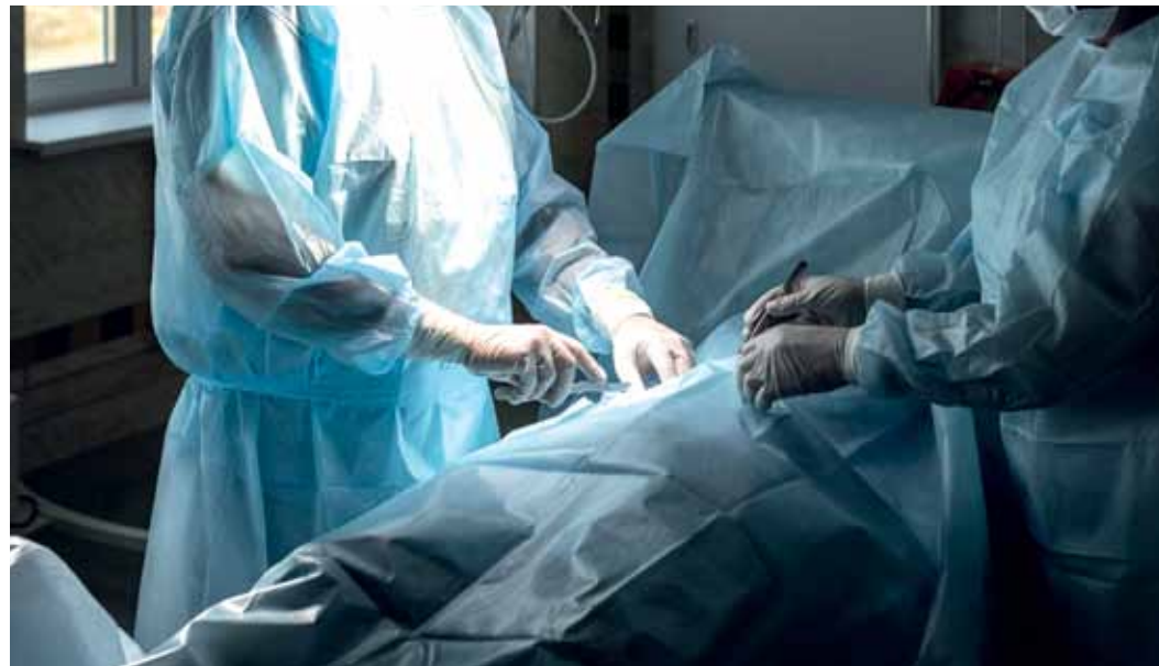
Бованенковские врачи незамедлительно приступили к оказанию экстренной помощи больной

Врачи медицинского комплекса «Бованенково» экстренно прооперировали подростка с острым аппендицитом. Заурядная и в то же время одна из самых сложных патологий в области хирургии, требующая неотложной помощи, застала врасплох 15-летнюю девочку из ямальской тундры. Штормовой ветер не позволил санитарному борту эвакуировать её в окружную столицу, поэтому родители привезли ребёнка на снегоходе к медикам «Газпром добыча Надым».