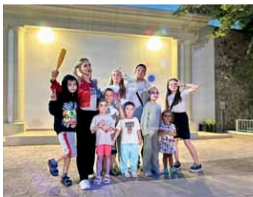
Тематическая вечеринка – отличный компаньон лета