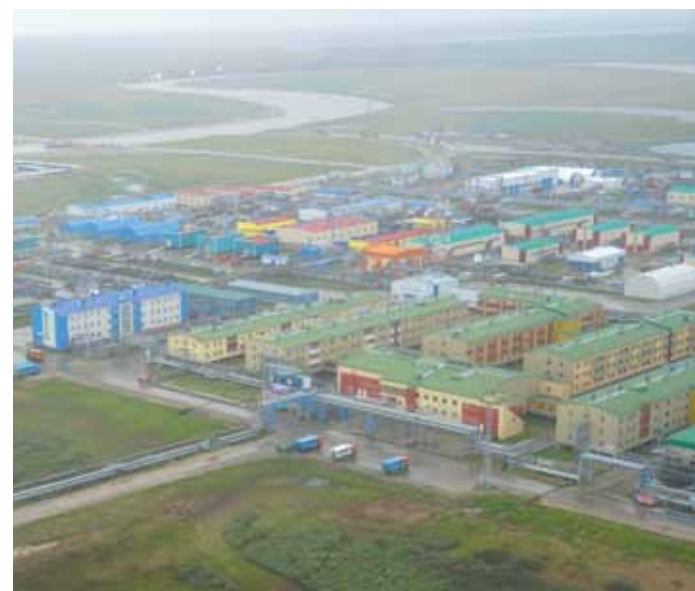
Вахтовый жилой комплекс на промбазе ГП-1 Бованенково