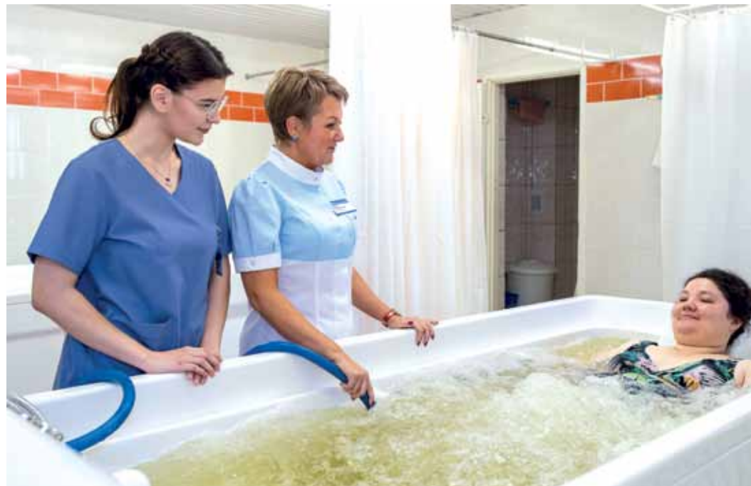
С улыбкой – к каждому пациенту. Надымские газовики регулярно приходят на оздоровительные процедуры