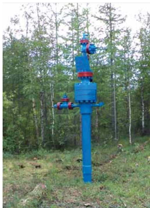
Сегодня первая скважина Юбилейного на отдыхе