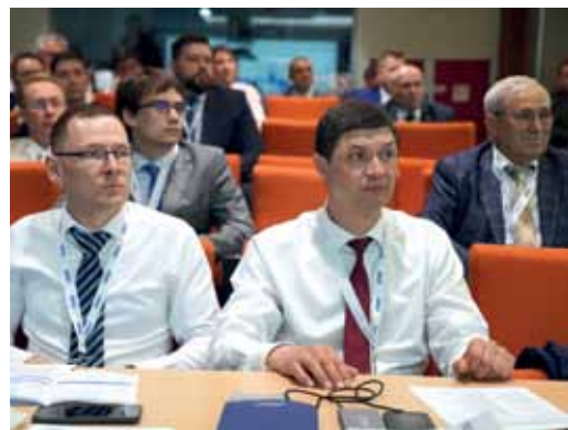
Надымские газовики – лидеры в изучении темы

Мария КОРОБОВА