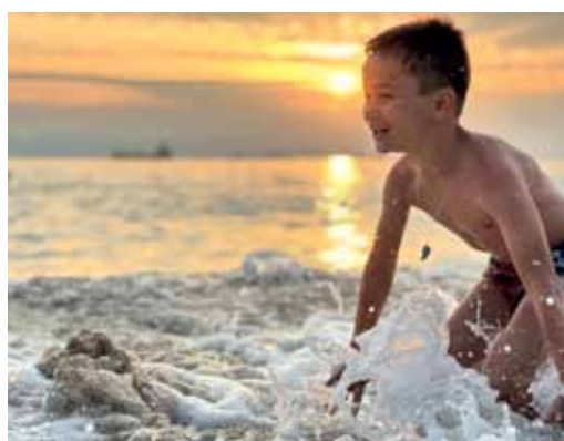
С Чёрным морем подружился навсегда!