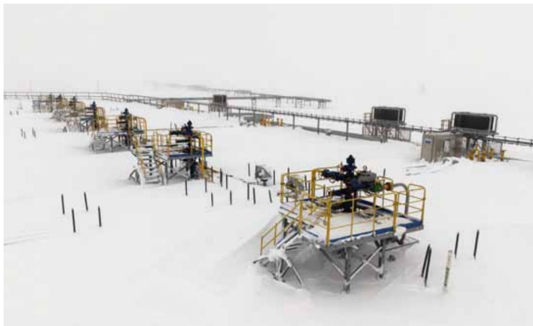
Кусты газовых скважин на БНГКМ. Теперь ремонт можно производить прямо на месторождении