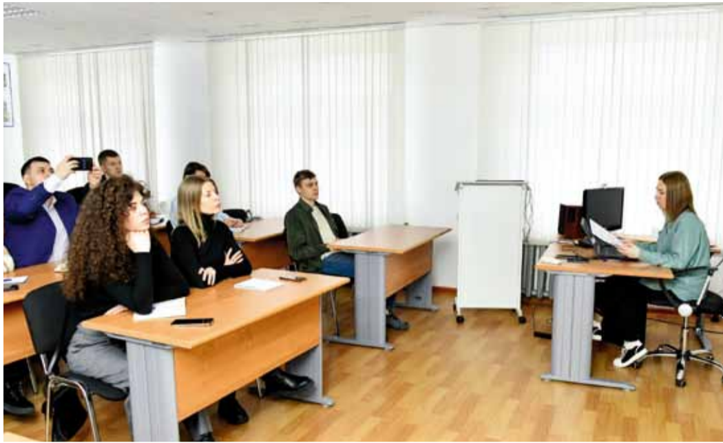
Участники консультационного семинара узнали для себя много нового

Проект реализуется с целью повышения компетентности руководителей, специалистов, служащих и рабочих в отношении правовых основ, гарантий самобытного социально-экономического и культурного развития коренных малочисленных народов, защиты их исконной среды обитания, традиционных образа жизни, хозяйственной деятельности и промыслов.