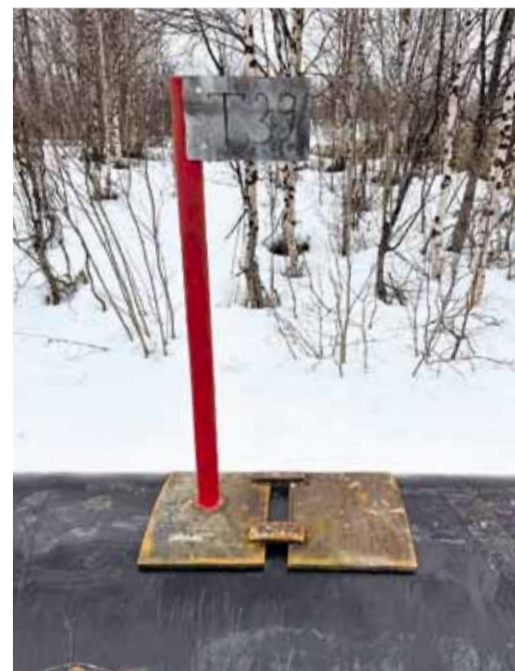
Сегодня на наших трубах установлено 52 маркера-репера