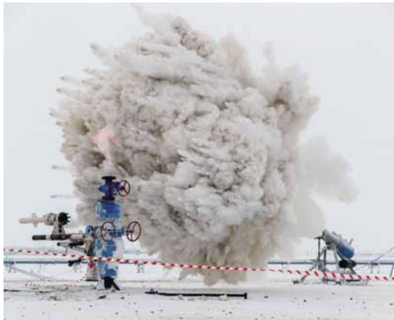
Тушение условного газового фонтана на скважине