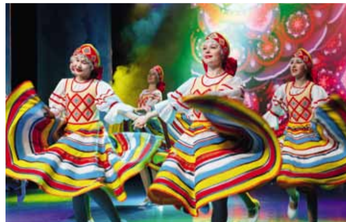
Образцовый хореографический коллектив «Каприз»