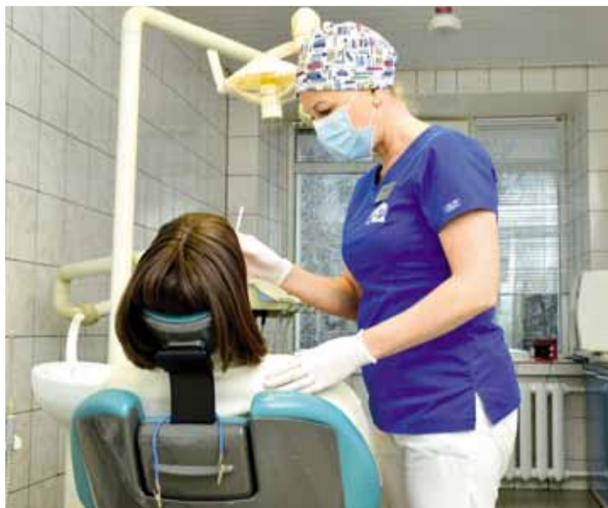
Чтобы болезни не притаились, нужен периодический медосмотр