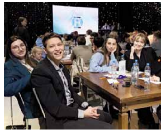
Блестим интеллектом, свершаем эрудицией