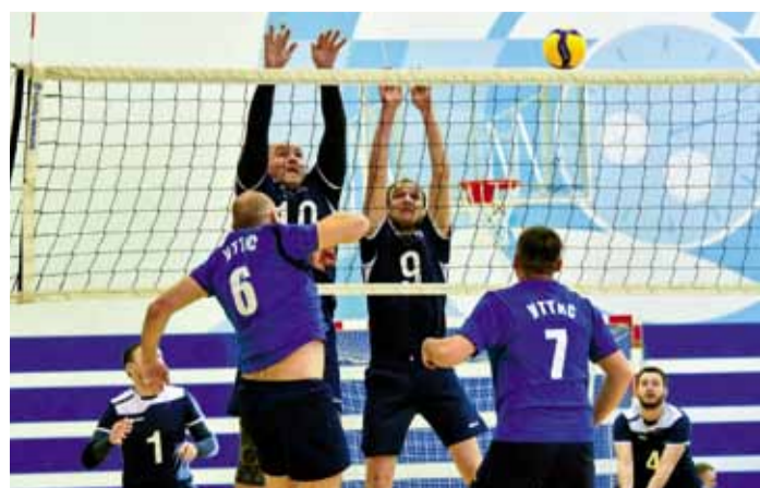
Встреча волейболистов УТТУС и МГПУ