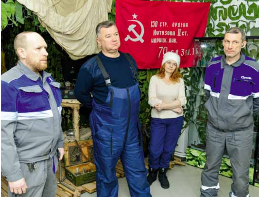
Собрание поисковиков в историческом музее на Бованенково

Поисковый отряд «Феникс» неустанно напоминает, что важно беречь историческую память нашей страны, и подкрепляет эту задачу конкретными делами. С 2015 года, когда был создан отряд на базе Управления «Ямалэнергогаз», значительно вырос квадрат поиска – экспедиции прошли в Псковской, Волгоградской, Калужской, Новгородской, Тверской областях, Республике Крым. Добровольцы «Газпром добыча Надым» активно участвуют во Всероссийской акции «Вахта Памяти». С помощью архивных документов составляют предстоящие маршруты.