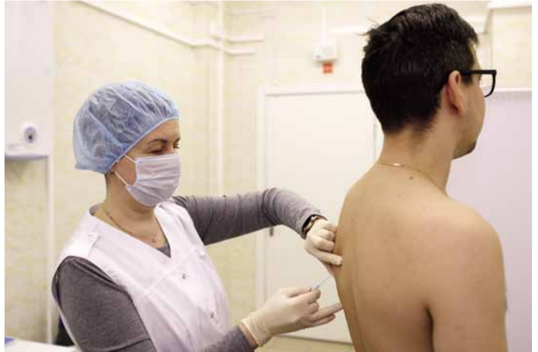
Необходимые препараты доставляют на Бованенково в плановом режиме