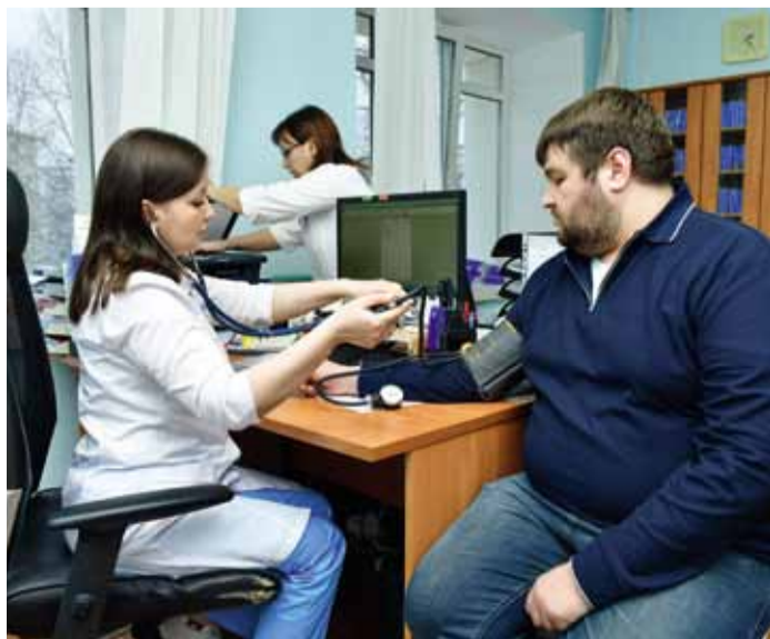
Медосмотр как инвестиция в капитал собственного долголетия