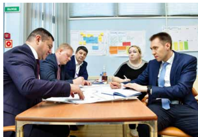
На апрельском форуме резервисты презентуют свои кейсы