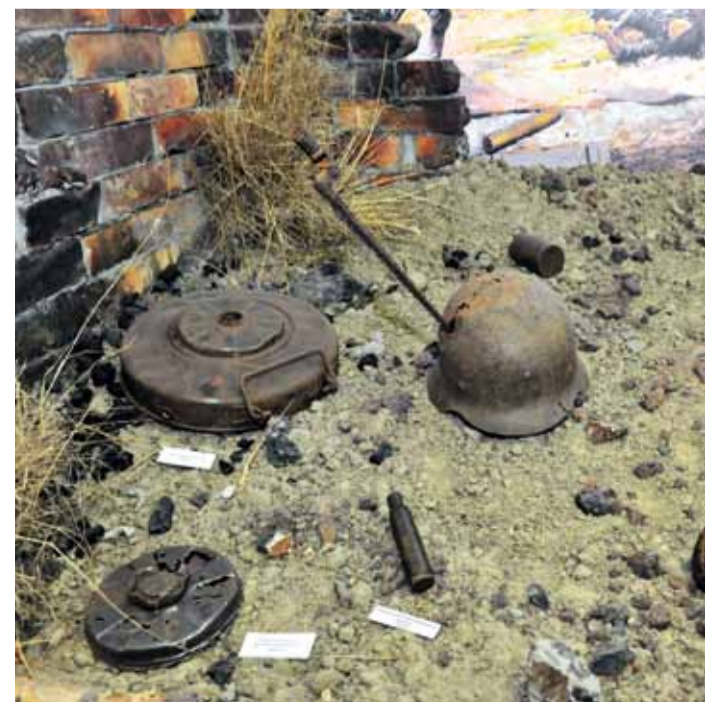
Элемент диорамы военного сражения с использованием находок поисковиков