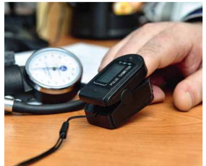
Счастье в трёх словах: здоровье, профпригодность, долголетие