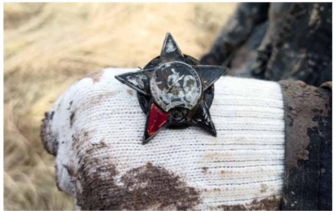
Одна из находок совместной экспедиции отрядов «Феникс» и «Обелиск»

Светлана СКОРЕНКО