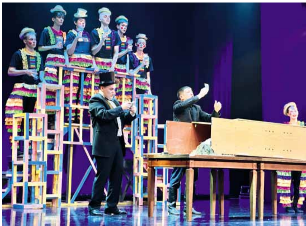
Парикмахер из уездного города Д. ищет «Средство от запоя для известного чтеца и комика Фениксова-Дикобразова»