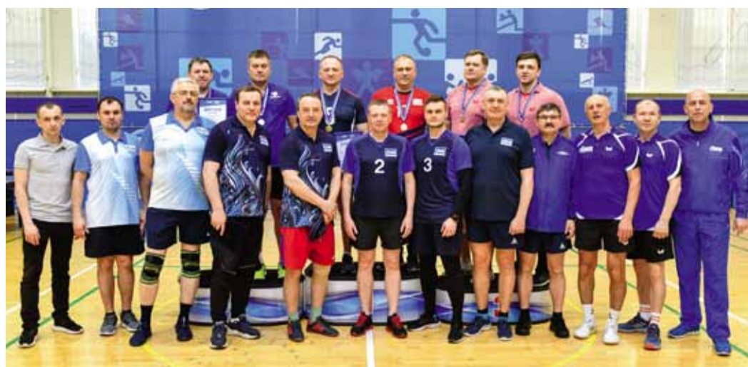
Победители и призёры соревнований по настольному теннису в зачёт Спартакиады руководителей (II лига)