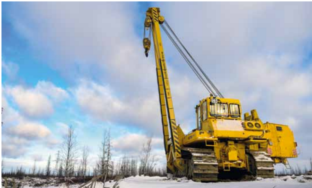
Маркеры позволяют предельно точно определять расположение выявленных дефектов, требующих ремонта

Мария ГАЛЛЯМОВА