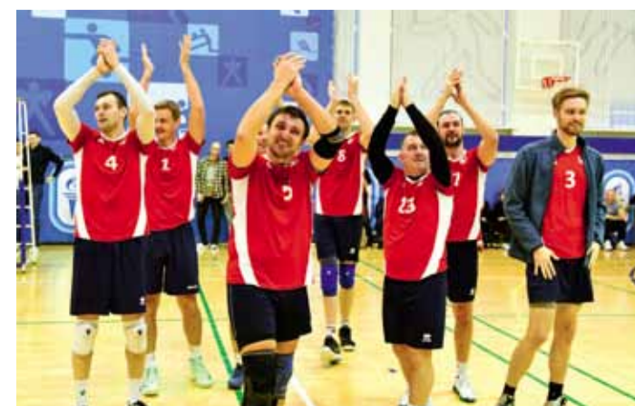
Чемпионы соревнований – команда Ямальского газопромышленного управления