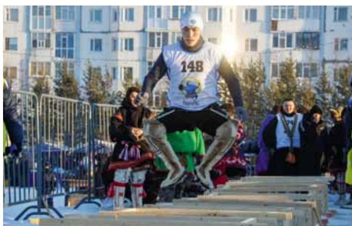
Прыжки через нарты – это имитация преодоления ручьёв