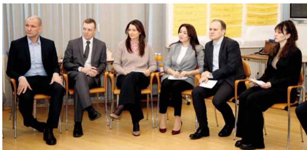
Подающие большие надежды сотрудники встретились на подготовительном этапе Первого форума резерва кадров

Мария КОРОБОВА