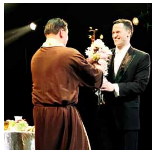
«Предложение» по рассказу А. П. Чехова