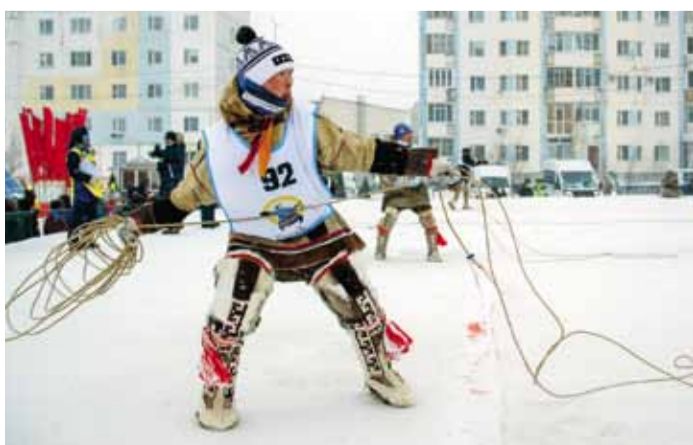
Уметь заарканить оленя – один из главных навыков тундровика