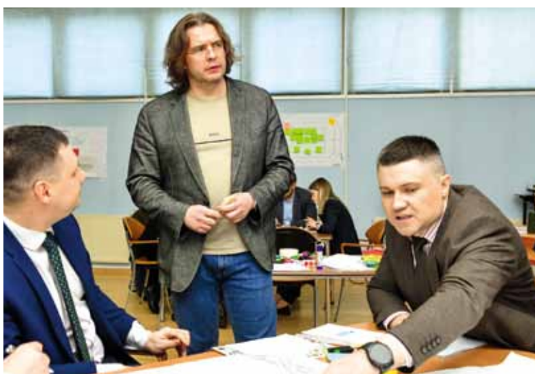
Берём энергию, нестандартные идеи и лидерские навыки, получаем – будущее компании