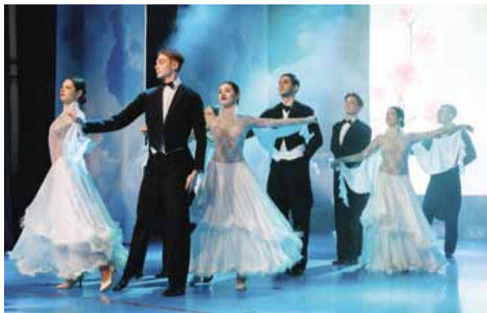
Хореографический коллектив спортивно-бального танца «Вдохновение»