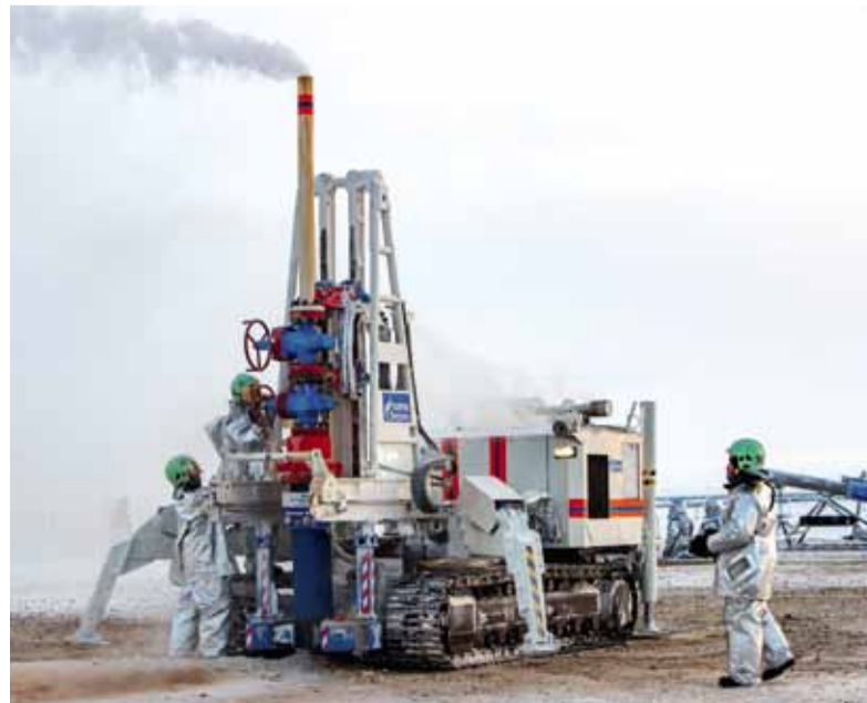
На Бованенково провели межведомственные учения «Безопасная Арктика – 2025»