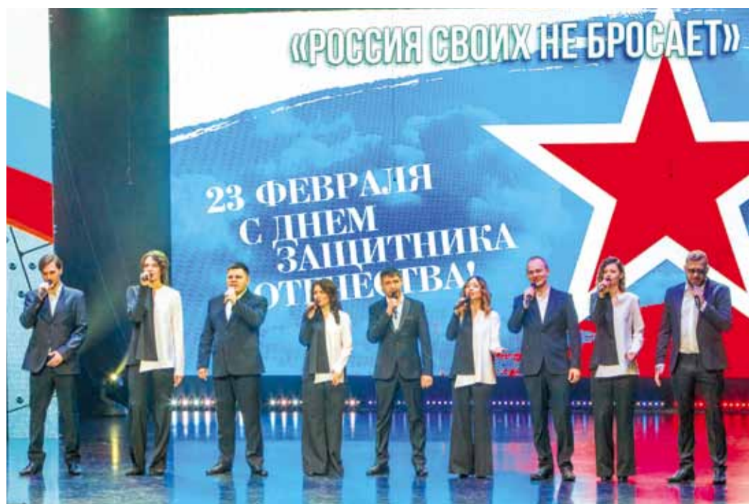
Студия вокального мастерства дома культуры «Прометей»