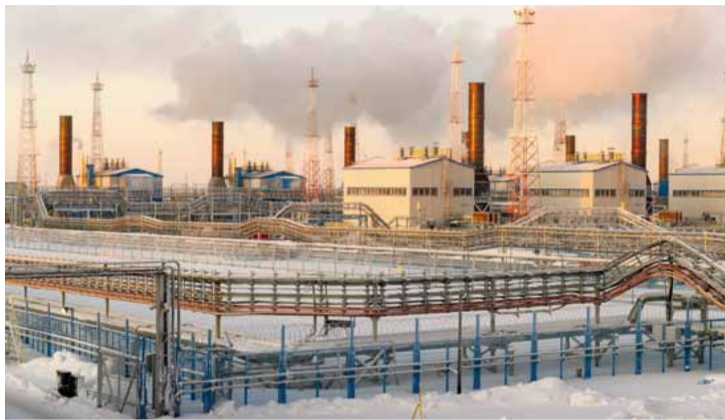
Дожимной комплекс газового промысла № 2 Бованенковского месторождения

Делу время, ремонту тоже. На втором промысле Бованенковского месторождения временно остановили один из газоперекачивающих агрегатов дожимной компрессорной станции третьей очереди. Причина уважительная – техническое обслуживание, первый полноценный комплекс процедур полагается оборудованию спустя три тысячи часов работы. Своевременный сервис обязателен, даже если срок эксплуатации машины едва превышает год. Газовики говорят, здесь нет понятия «возраст», есть только «наработка». От качества проведения регламентных работ напрямую зависит надёжность работы производственных объектов и, как следствие, выполнение плана по добыче газа.