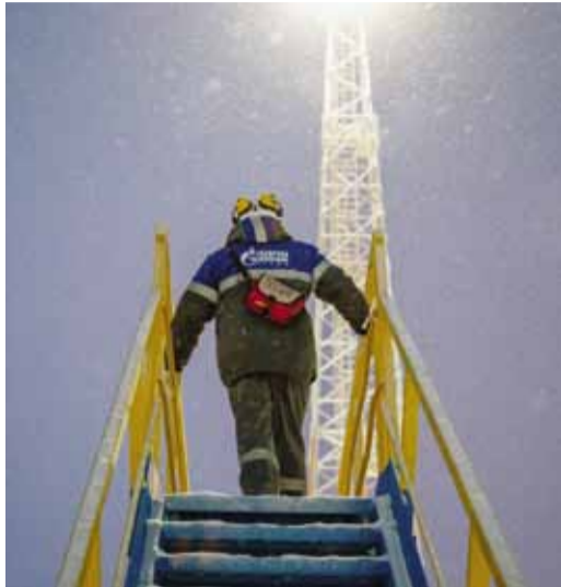
Рационализаторы компании вносят весомый вклад в развитие нефтегазовой отрасли

Курс на созидание. Новаторы «Газпром добыча Надым» продолжают держаться заданного вектора и своим умом добывают компании не только практическую, но и финансовую пользу. 2024-й не стал исключением – по итогам прошлого года инициативные технари (и не только) придумали более 800 новых предложений. На экономическом это – многомиллионная польза.