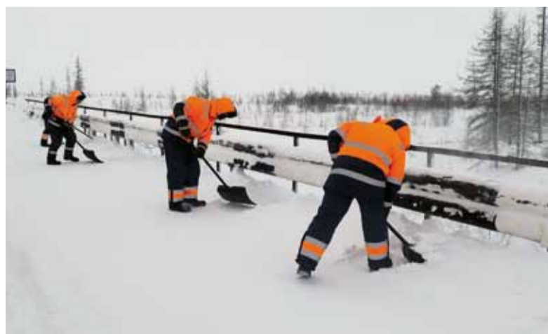
Очистка мостовых переходов в Надым-Пур-Тазовском регионе