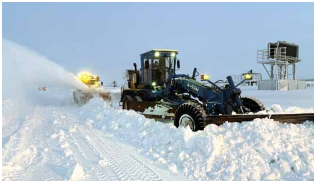
Уборка снега на Бованенковском месторождении. Дорожники вовремя устраняют пережёты и валы

Слаженно взаимодействуют водители автогрейдеров, бульдозеров, шнекороторов, универсальной дорожно-строительной техники, комбинированных дорожных машин. Активно работает спецтехника. Всегда на ходу и передвижная мастерская, поскольку ремонт