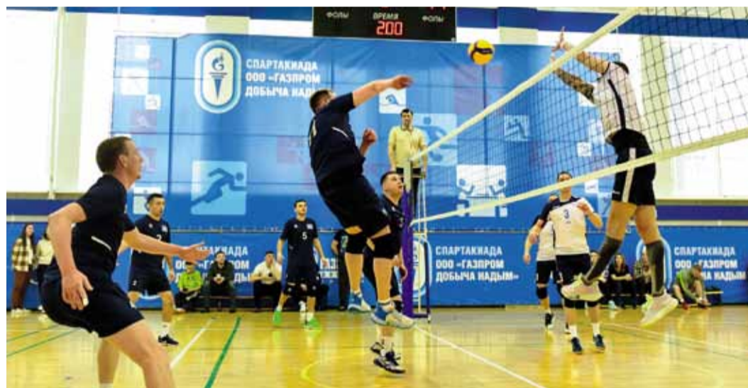
Игра за третье место с ННГДУ закончилась со счётом 2:0 в пользу СКЗ

Спартакиаду работников «Газпром добыча Надым» продолжили соревнования по волейболу среди мужских команд. В них приняли участие 13 филиалов компании. Борьба за выход в 1/4 велась в подгруппах, а победителя и призёров определили уже финальные игры – им свойственны высокое напряжение и зрелищные моменты. Болельщики давно не видели такой захватывающей борьбы у сетки. Это был по-настоящему красивый волейбол!