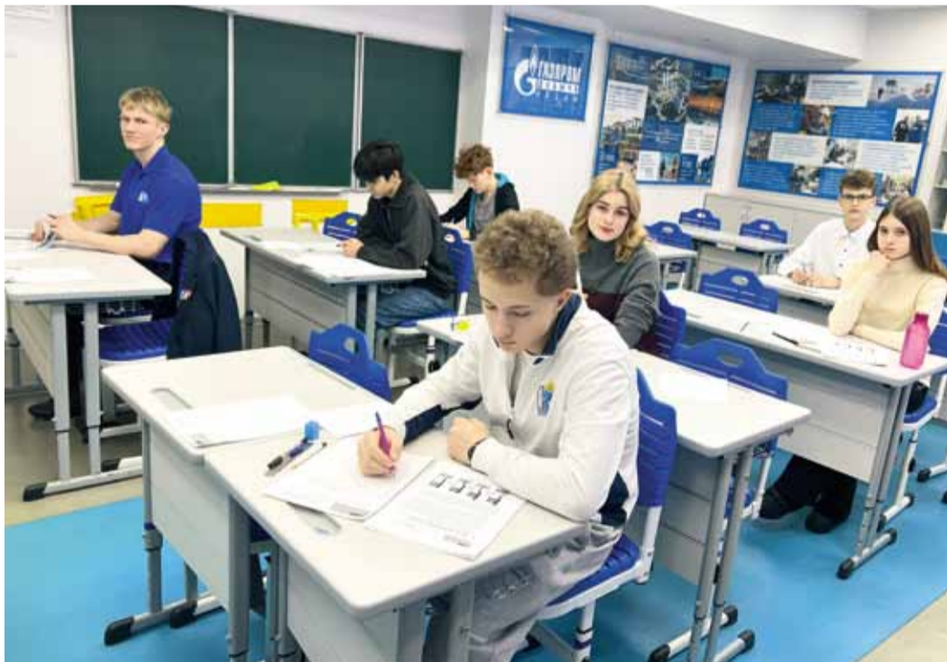
Участие и победа в олимпиаде позволят заработать баллы к ЕГЭ при поступлении в вуз