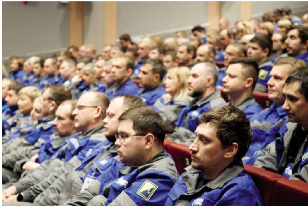
Работники Бованенковского нефтегазоконденсатного месторождения

Значимые изменения происходят и на объектах социальной инфраструктуры, в вахтовых жилых комплексах (ВЖК) «медвежинцев» продолжается серия ремонтов. Глава компании осмотрел общежитие № 3, сейчас здесь вносят финальные штрихи после глобального преобразования. Над обликом и содержанием поработали капитально: выровняли и усилили свайное основание, заменили инженерные сети водоснабжения и водоотведения, электроснабжения и освещения, обновили облицовку стен, потолка и покрытие пола, переоборудовали санитарные узлы, установили новые дверные блоки