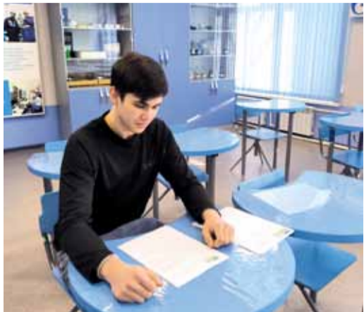
22 февраля состоялась олимпиада по математике

Завершается Отраслевая олимпиада школьников «Газпром» для старших классов. Получение необходимого опыта, дополнительные баллы к ЕГЭ и ещё один шаг к мечте – молодые северяне уверенно идут в газовую отрасль. Те, кто успешно справился с отборочными испытаниями в заочном формате, перешли на второй, заключительный этап.