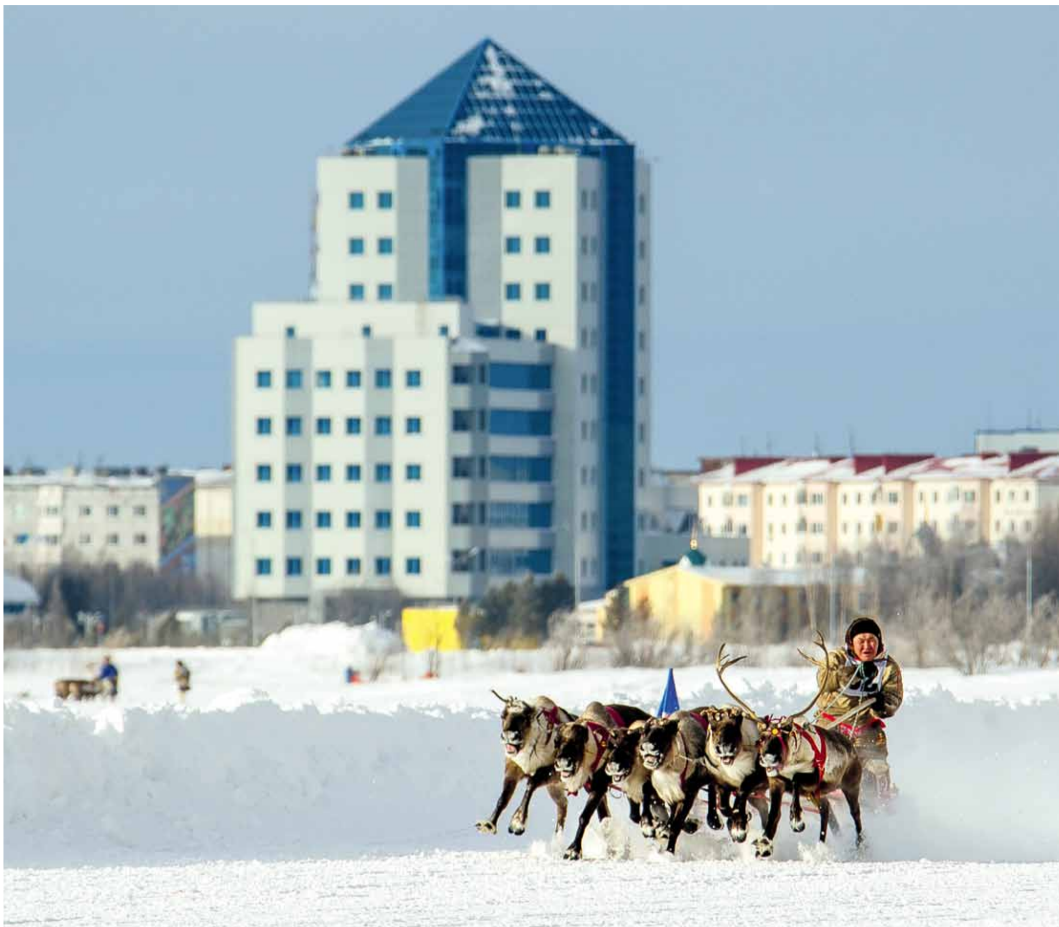
В НАДЫМЕ СОСТОЯЛИСЬ XXIX ТРАДИЦИОННЫЕ СОРЕВНОВАНИЯ ОЛЕНЕВОДОВ НА КУБОК ГУБЕРНАТОРА ЯМАЛА. НЕИЗМЕННЫЙ ГЕНЕРАЛЬНЫЙ ПАРТНЁР СОБЫТИЯ – «ГАЗПРОМ ДОБЫЧА НАДЫМ». СПЕЦИАЛЬНЫЙ ПРИЗ ОТ ГЕНЕРАЛЬНОГО ДИРЕКТОРА КОМПАНИИ ВРУЧЁН ПОБЕДИТЕЛЮ ГОНОК НА УПРЯЖКАХ.