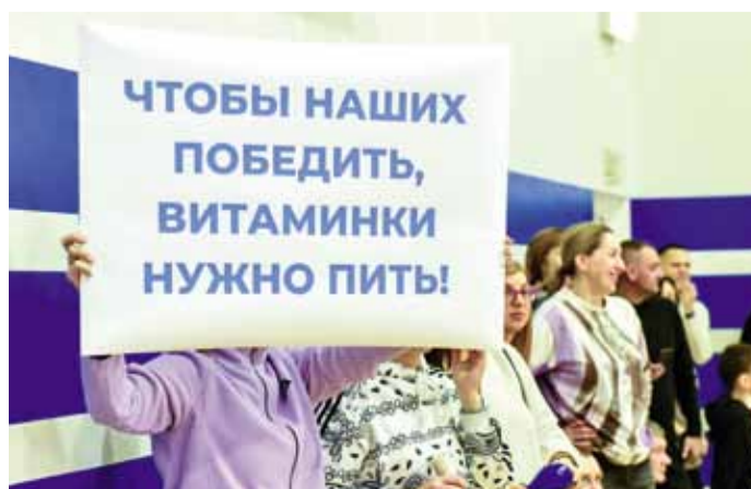
Болельщики получили море эмоций