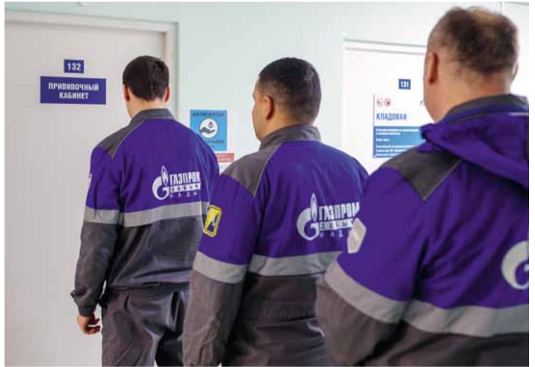
В процедурный кабинет газовиков приглашают, ориентируясь на заранее составленный план