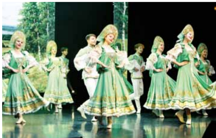
Хореографический ансамбль «Метелица»