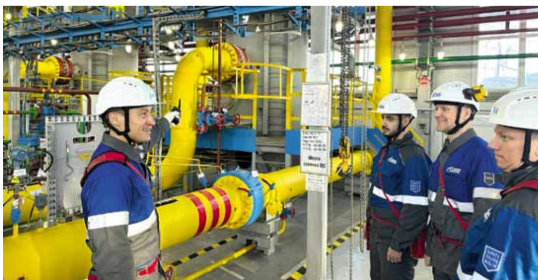
Обсуждение с работниками цеха возможных возникновений рисков и опасностей в процессе выполнения работ