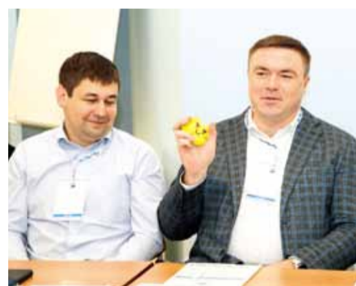
Слушатели тренируют управленческие компетенции

В течение двух дней 16 работников компании наращивали и тренировали свои управленческие компетенции. Программа консультационного семинара насыщена содержательными практическими и теоретическими занятиями – от материального стимулирования до разрешения конфликтов.